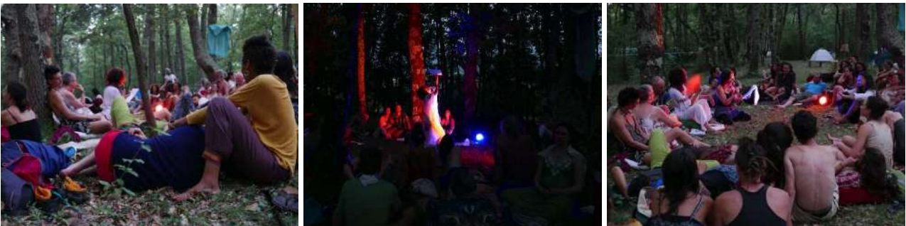
Lectures publiques Lovestival – Saint-Victor-Rouzaud – juillet 2019

Cindy (lecture Lovestival à Saint-Victor-Rouzaud, juillet 2019)