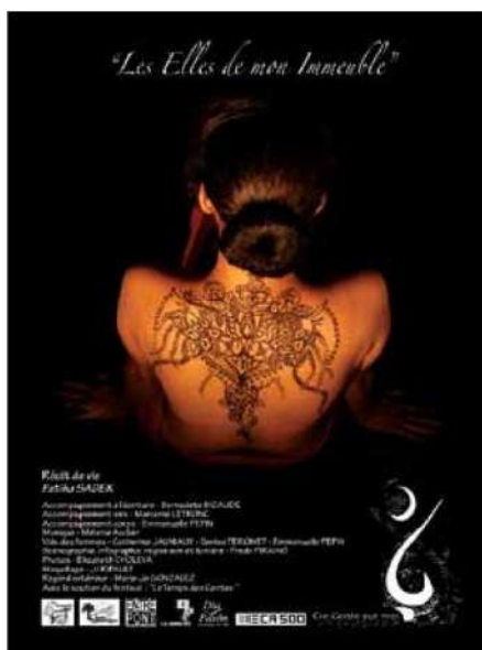
Les Elles de mon immeuble – création 2013

- La Femme d'argile , spectacle à partir du collectage de récits de femmes sur le thème du retour aux racines familiales, de la résilience entre le pays d'origine et le pays d'adoption – France / Maroc (2005)