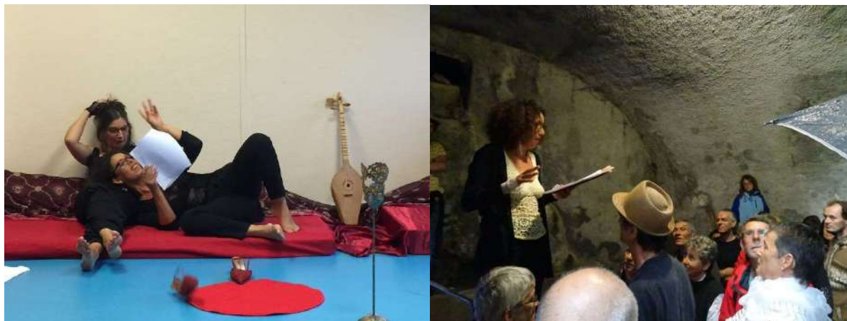
Lectures publiques Marseille & Saorge – 2018

Nous racontons des histoires intimes faisant écho au plus grand nombre.